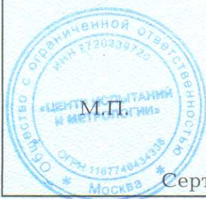
Схема сертификации: Зс.